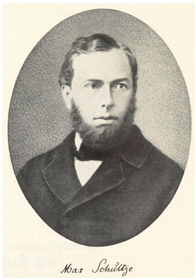
Рис. 1. Максимилиан Иоганн Сигизмунд Шульце (1825—1874).

Максимилиан Иоганн Сигизмунд Шульце (1825—1874) — известный немецкий анатом и зоолог, гистолог, создатель теорий протоплазмы и «двойственности зрения». В научной и биографической литературе его имя часто звучит как Макс Шульце.